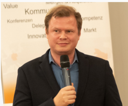
米歇尔·萨洛莫 德国海登海姆市市长