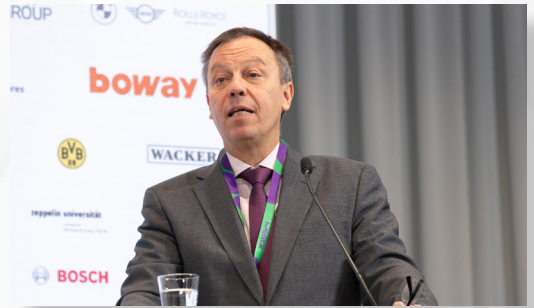
克劳斯·穆尔哈恩教授 (余凯思)