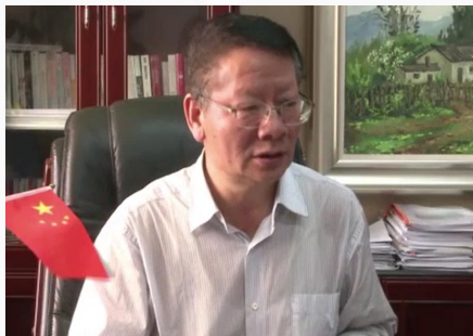
陈世波教授 云南省委教育工委书记