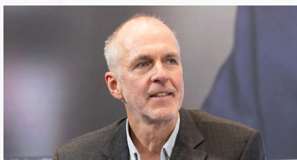
唐思合教授 德国默克集团硅谷及中国创新中心负责人