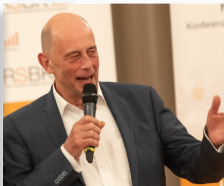
沃尔夫冈·蒂芬泽 图林根州经济、科学和数字化社 会部部长