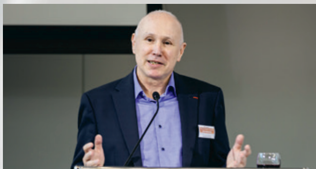
迪特尔·莱昂哈德教授