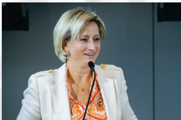
尼科尔·霍夫迈斯特-克劳特博士 德国巴登符腾堡州经济、劳动和旅游部部长