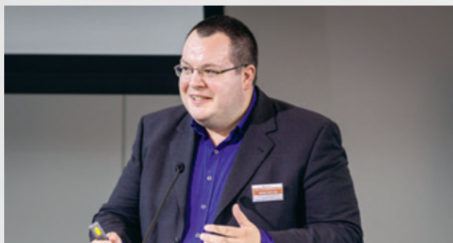
帕特里克·格劳纳教授