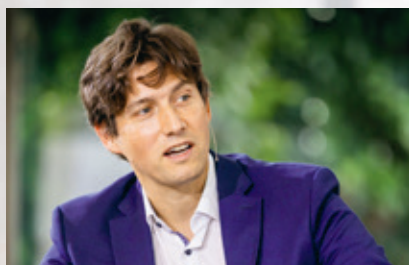
塞巴斯蒂安·施密特 德国《证券报》主编