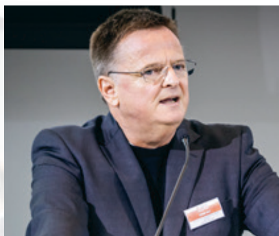
克劳斯·帕尔 斯图加特工商会会长