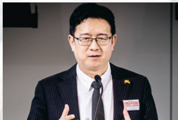
黄昶扬 中国驻法兰克福总领事