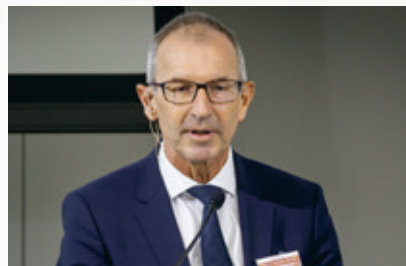
安德里亚斯·阿特曼教授