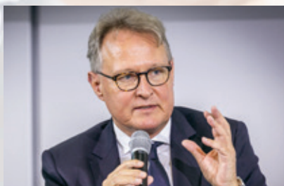
明悟非 德国安联保险集团执行副总裁、 政治关系全权代表